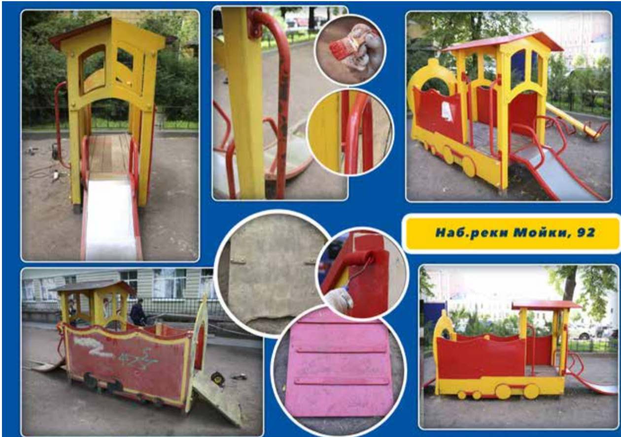
Наб. реки Мойки, 92