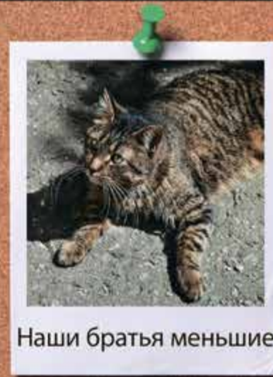
Наши братья меньшие

Газета «Адмиралтейский Вестник» Учредитель: Муниципальный совет Муниципального образования Адмиралтейский округ Тираж: 7000 экз. Распространяется БЕСПЛАТНО