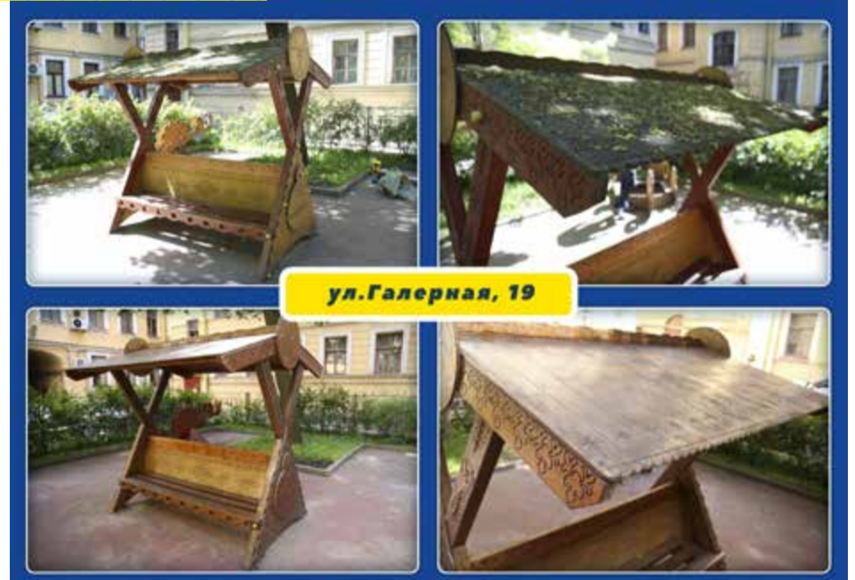
ул. Галерная, 19