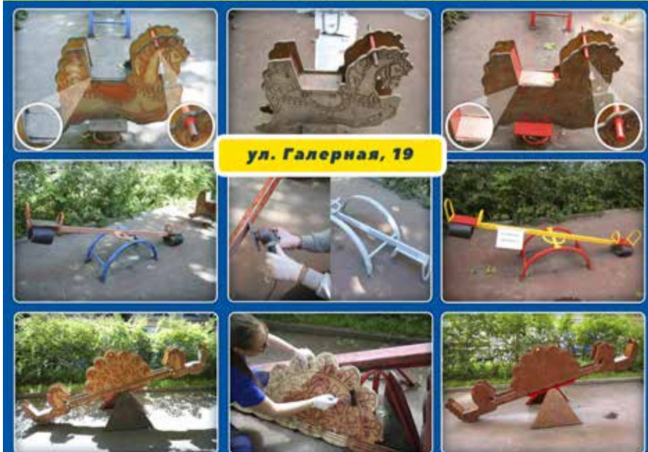
ул. Галерная, 19