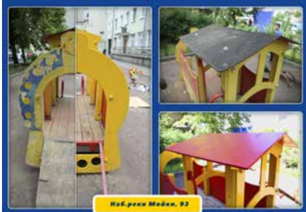
Наб. реки Мойки, 92

Детские площадки — это огороженная территория, территория детства, радости, веселья и задорного смеха. За надежным заборчиком дети и их родители будут чувствовать себя защищенными. Особенно это важно для площадок, расположенных в небольшом дворике, который служит еще и парковкой для автомобилей. С помощью декоративного ограждения обычная игровая площадка с легкостью превратилась в настоящее детское царство. Каждый ребенок теперь с удовольствием играет в своем королевстве, осознавая, что вся эта красота создана именно для него.